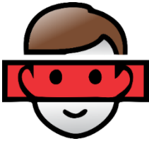
Lector de Rostro