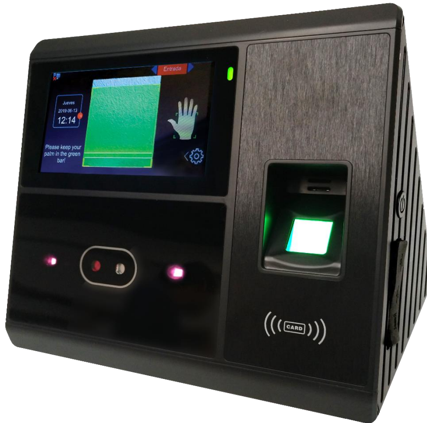
Lector de Palma