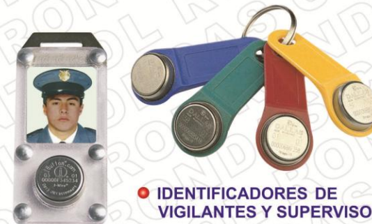
• IDENTIFICADORES DE VIGILANTES Y SUPERVISORES