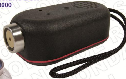
• REGISTRADOR M6000