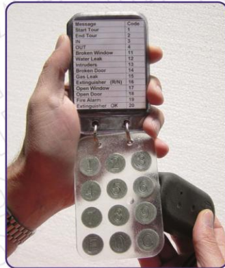
• LIBRETA DE INCIDENTES