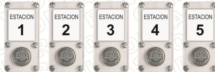
• ESTACIONES DE REGISTRO