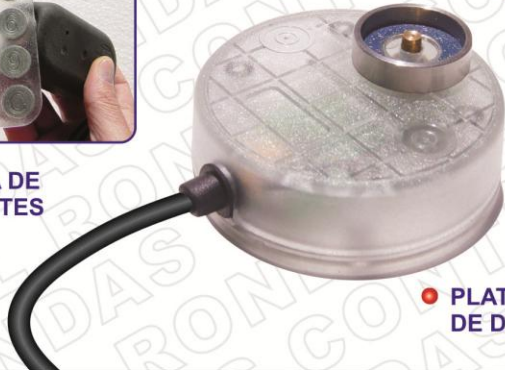
• PLATAFORMA DE DESCARGA